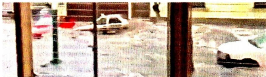
■ Desde una cochera de Naucalpan, un vecino pudo grabar el paso de los coches.