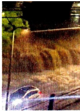
■ Cruzar con el cauce crecido se volvió todo un reto.