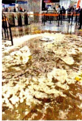
■ En Cuatro Caminos, el agua entró a los pasillos.

mes, en la Colonia Fuentes de Tecamachalco.