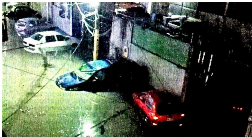
■ En la zona de Río de los Remedios, el caudal llegó con tal fuerza, que arrastró vehículos.