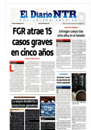
AGRO. También les preocupa costo del forraje.