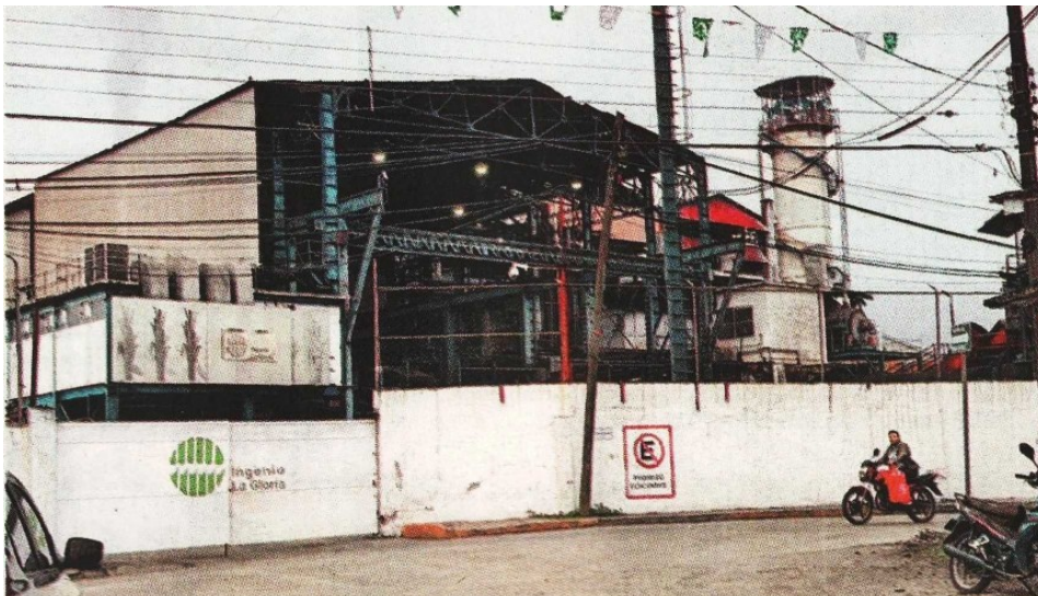
Visita de MILENIO a ingenios del estado de Veracruz.