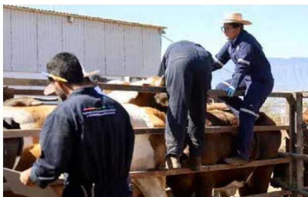
Falta pie de foto....