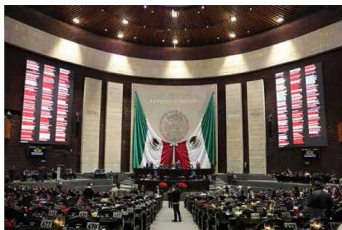
Aprueban reformas a Ley del Agua.