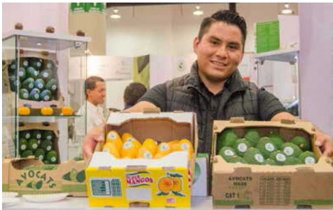
Exportaciones de mangos y aguacate.

LA IMPORTACIÓN EXCESIVA DE CARNE Y EL CIERRE A LA EXPORTACIÓN DE GANADO YA ACUMULAN TRES MIL MILLONES DE PESOS EN PÉRDIDAS”.