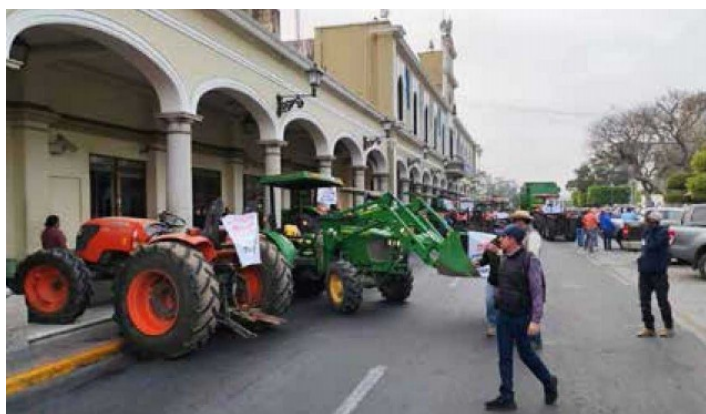
Protestas en Ciudad Guzmán.