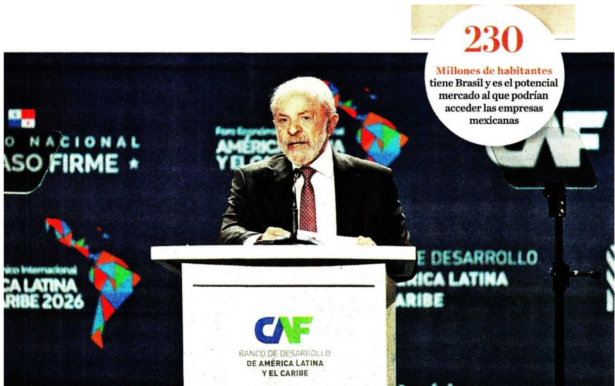
El presidente Luiz Inácio Lula da Silva anunció en el foro anual de CAF la ampliación de la relación.