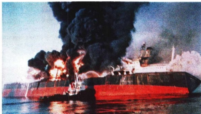
Fracasan negociaciones. El conflicto en la región se encuentra lejos de terminar.

“Es un panorama muy complejo. Venimos de una circunstancia de bajos precios en productos como el maíz o la soya por un exceso de oferta, pero ahora el conflicto en Irán está generando disrupciones en la oferta de fertilizantes nitrogenados y un incremento en costos energéticos como el diésel y la electricidad”, explicó.