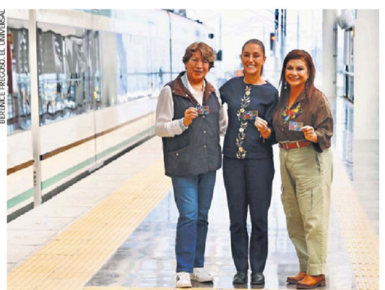
Delfina Gómez, gobernadora del Estado de México; la presidenta Claudia Sheinbaum y Clara Brugada, jefa de Gobierno de la CDMX, supervisaron la obra.

La presidenta Claudia Sheinbaum anunció que a finales de enero de 2026 operarán las dos estaciones faltantes del Tren Interurbano México-Toluca, El Insurgente , para que esté completo el recorrido de Zinacantan a Observatorio.