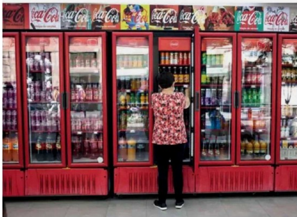
México, entre los países que más consume bebidas azucaradas