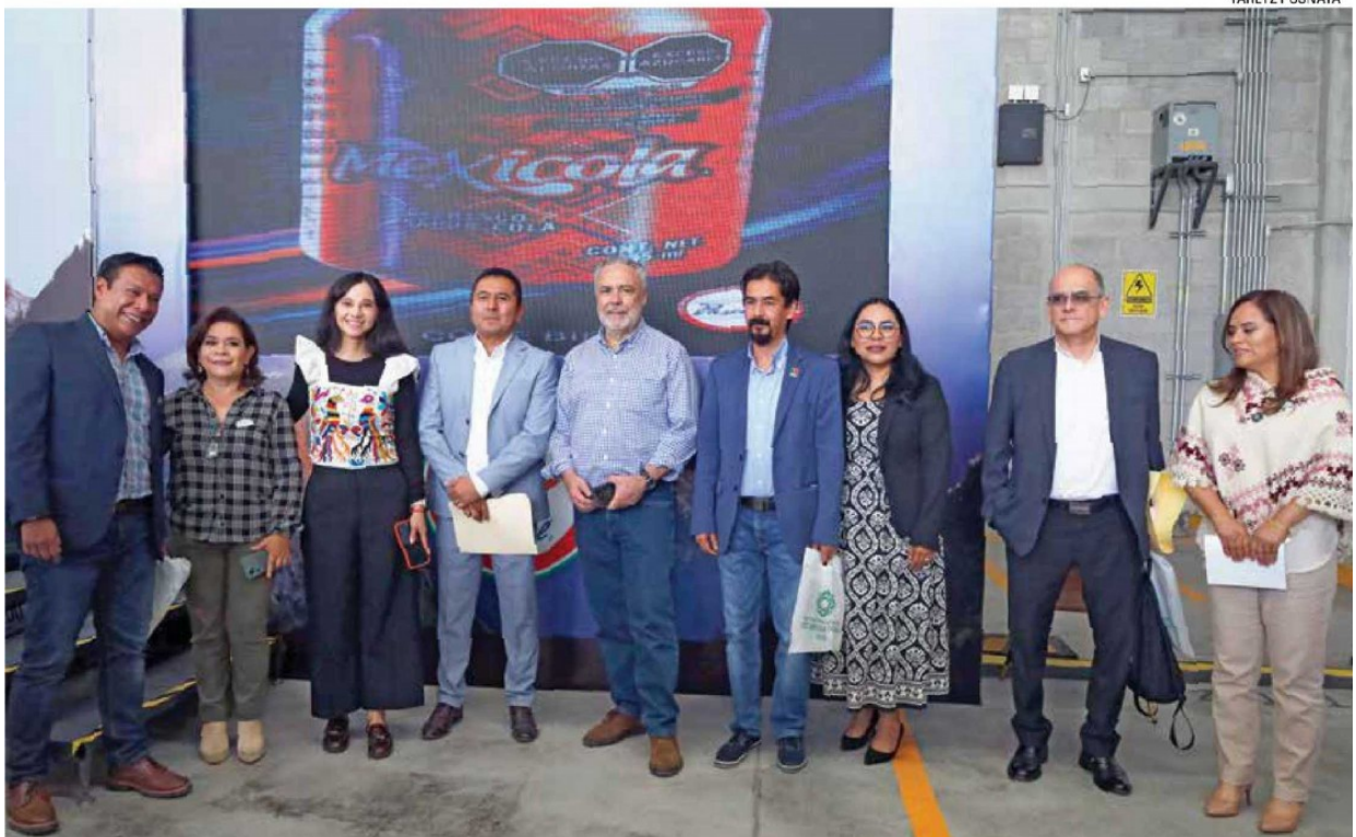
PRIMER FORO Nacional de Cooperativas 2026 "Construyendo Economía Solidaria", uniendo fuerzas en pro de las finanzas de refresqueras mexicanas.