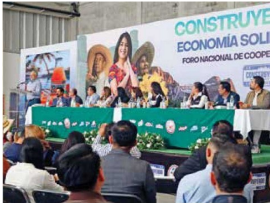
EL EVENTO reunió a representantes de organizaciones y cooperativas del país, legisladores y funcionarios hidalguenses.

incremento del IEPS sin que esto repercuta en el crecimiento de la empresa"