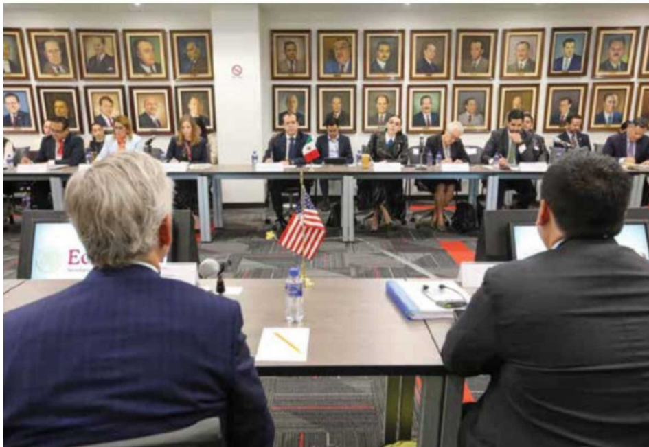
ENCUENTRO. Las delegaciones de México y Estados Unidos, en la primera ronda de negociaciones del T-MEC.