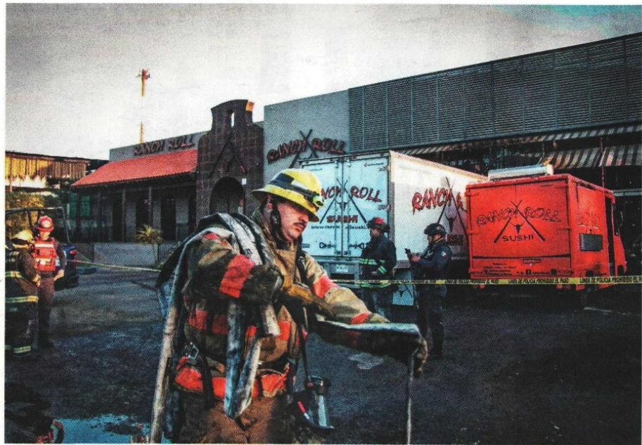
Culliacán. Bomberos acudieron a contener un incendio en una sucursal de un restaurante de comida japonesa, pero fueron recibidos con balazos al aire y se retiraron.