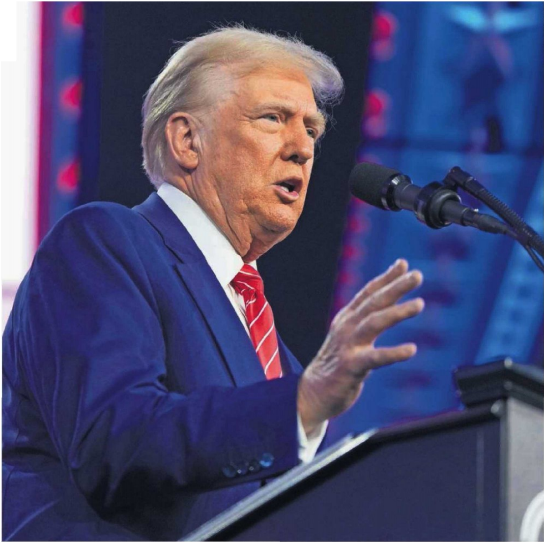
Con el discurso de que los cárteles mexicanos deben considerarse como grupos terroristas, el presidente electo de Estados Unidos, Donald Trump, busca obtener una ventaja desleal en las renegociaciones del T-MEC, dijeron legisladores morenistas.