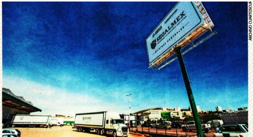
Seguridad Alimentaria Mexicana fue creada por Andrés Manuel López Obrador.

La Secretaría Anticorrupción y Buen Gobierno ordenó la nueva auditoría a Seguridad Alimentaria Mexicana.