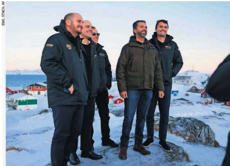
Donald Trump Jr., segundo de der. a izq., ayer a su llegada a Nuuk, Groenlandia.